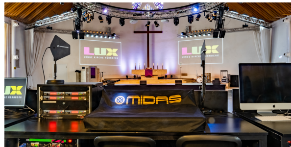
Blick vom FOH-Platz auf den Kirchen- raum

Mehr Bilder der Venue mit technischen Details findest du auf lux-jungekirche.de/venue-rider