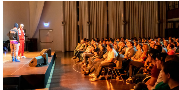
550 Personen bestuhlt