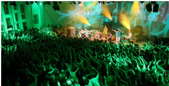
800 Personen stehend