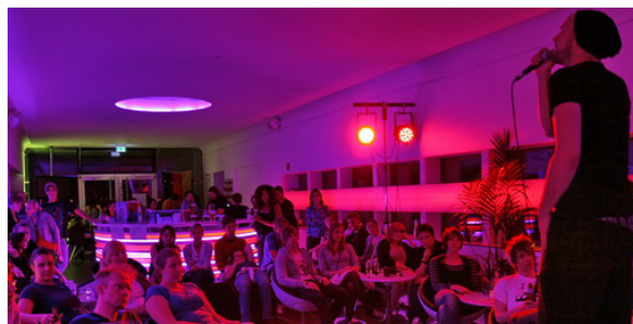
Event in der LUX-Box

Größere technische Anforderungen können nach Rücksprache realisiert werden.