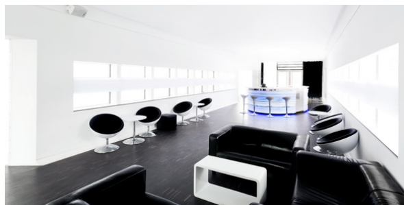
Nutzung als Foyer / Bar